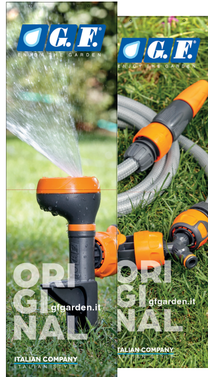
Bandiera Original con supporto magnetico / Original banner with magnetic holder / Banner Original avec support magnétique / Banner Original mit Magnethalterung / Banner Original con soporte magnético (29x99 h)