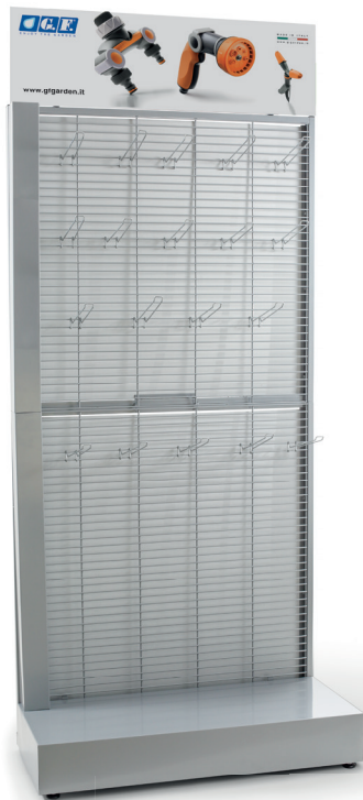
Espositore "Linear" / "Linear" display stand Présentoir "Linear" / Display "Linear" / Expositor "Linear"