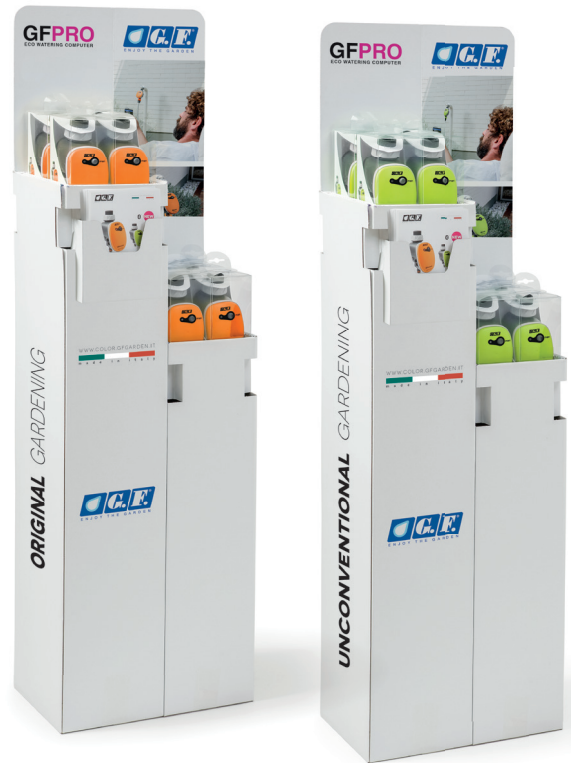
Espositore per programmatore GFPRO Eco Watering Computer Bluetooth® Display case for Bluetooth® GFPRO Eco Watering Computer programmer Présentoir pour programmeur GFPRO Eco Watering Computer Bluetooth® Zweitflächendisplay Bewässerungscomputers Expositor para programador GFPRO Eco Watering Computer Bluetooth®