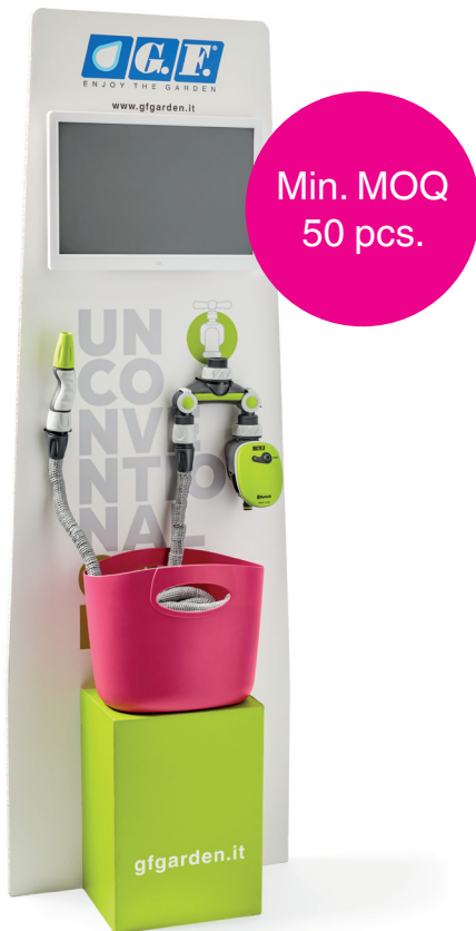
Totem Video - spedito vuoto / Totem Video - shipped empty Totem Video - livré vide / Totem Video - leer geliefert / Totem Video - enviado vacío