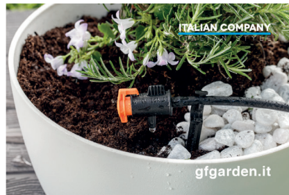
Crowner Microirrigazione / Micro-irrigation Crowner / Crowner micro-irrigation / Crowner Mikrobewässerung / Crowner microrriego (132x29 h)