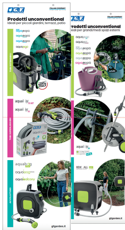
Bandiera Unconventional con supporto magnetico / Unconventional banner with magnetic holder / Banner Unconventional avec support magnétique / Banner Unconventional mit Magnethalterung / Banner Unconventional con soporte magnético (29x99 h)

ITA GF21001197 EN GF21001198 FR GF21001199