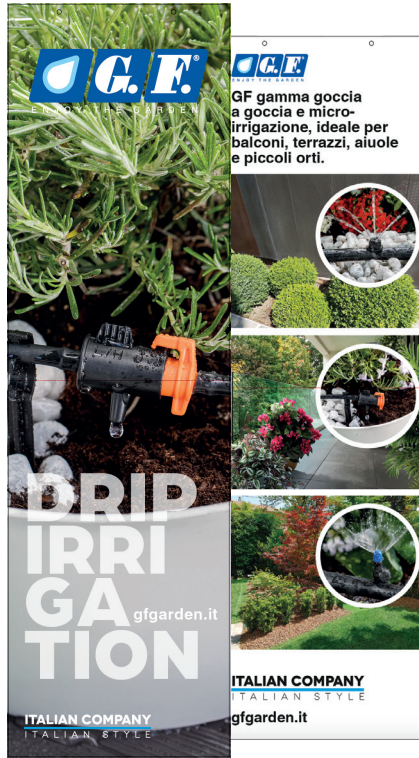
Bandiera Microirrigazione con supporto magnetico / Micro-irrigation banner with magnetic holder / Banner de micro-irrigation avec support magnétique / Banner für Mikrobewässerung mit Magnethalterung / Banner de microrriego con soporte magnético (29x99 h)

ITA GF21001191 EN GF21001192 FR GF21001193