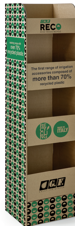
Espositore a colonna "Tower" / "Tower" column display stand Présentoir à colonne "Tower" / Display "Tower" / Expositor de columna "Tower"

GF32000069 Box (LxWxH) cm 52x152x10 In Store (LxWxH) cm 56x56x152