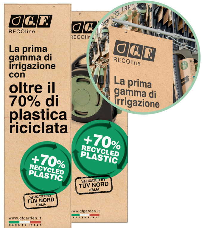
Bandiera RECO con supporto magnetico / RECO banner with magnetic holder / Banner RECO avec support magnétique / Banner RECO mit Magnethalterung / Banner RECO con soporte magnético (29x99 h)

ITA GF21001190 EN GF21001186 FR GF21001172