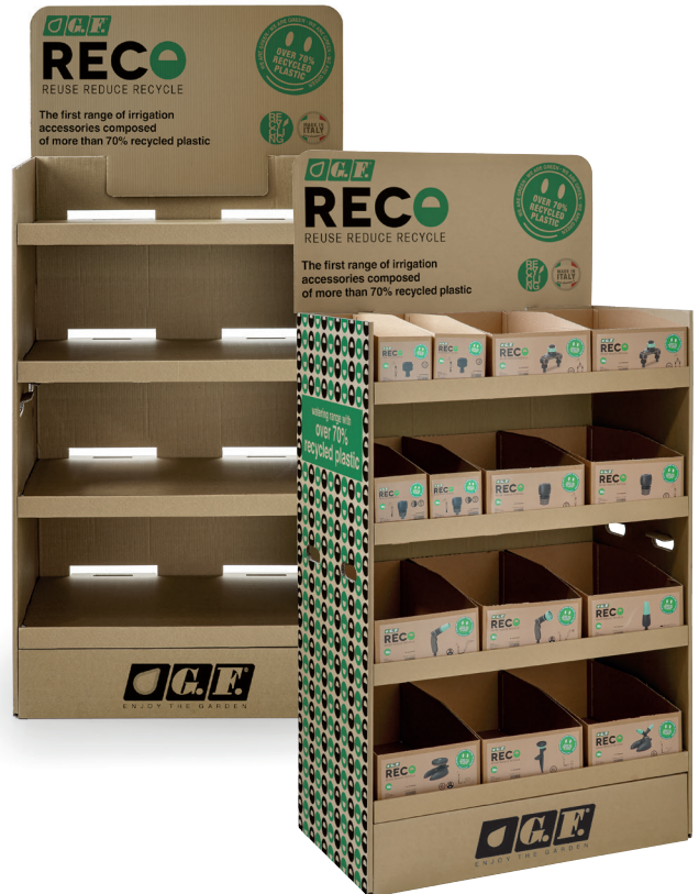
Espositore "Cutcase" / "Cutcase" display stand Présentoir "Cutcase" / Display "Cutcase" / Expositor "Cutcase"